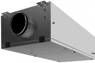
Приточная установка SUPK-W