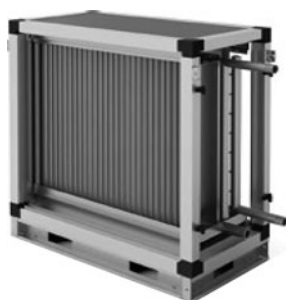
Секция водяного охлаждения

Секции представлены 8 типоразмерами, в каждом из которых доступны два исполнения: трёхрядное и четырёхрядное. Поверхность теплообменника изготовлена из алюминиевых пластин и проходящих через них в шахматном порядке медных трубок. Трубные коллекторы из стали имеют резьбовые патрубки для