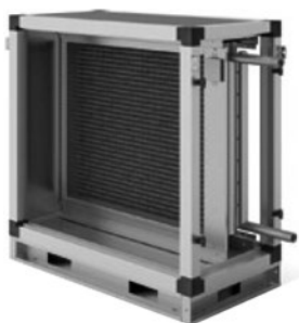
Секция водяного нагрева

Секции водяного нагрева представлены восемью типоразмерами, в каждом из которых возможны два исполнения: двухрядное и трёхрядное. Предназначены для эксплуатации при максимальном рабочем давлении 1,5 МПа и максимальной рабочей температуре воды 170°C. Поверхность теплообмена изго-