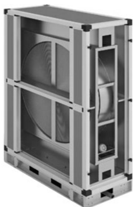
Секция роторного регенератора

Секции представлены шестью типоразмерами. Нагрев холодного приточного воздуха осуществляется за счёт аккумуляции теплоты вытяжного воздуха на поверхности теплообмена с последующей ее отдачей. Поверхность теплообмена образована вращающимся барабаном из волнообразных алюминиевых лент. В роторных регенераторах возможен небольшой переток между потоками воздуха. Щёточное уплотнение, размещённое по ободу ротора и на линии раздела, снижает переток воздуха. Все секции стандартно оснащены поддоном с патрубком для отвода