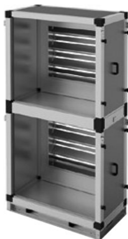
Секция перекрывающая (с 2 заслонками)

Секции предназначены для разделения и перекрытия воздушных каналов основного и резервного вентилятора. Секция S3 предназначена для установки на стороне входа вентиляторов. Секция S4 предна-