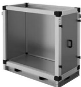
Секция забора воздуха сверху (выхлопа вверх)

Секции представлены восемь типоразмерами. Секция Z2 доукомплектовывается верхней торцевой панелью: для забора воздуха - с заслонкой и мягкой вставкой, для выхлопа воздуха - мягкой вставкой.