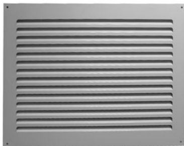
Решетка декоративная DGS для DKS (КДМ-2м)

Решетка декоративная DGS применяется в качестве дополнительного аксессуара к клапанам DKS (КДМ-2м). Особенности данной решетки являются низкое аэродинамическое сопротивление, улучшенный