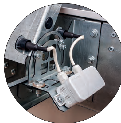
Блок контроля конечных положений крышки люка (БККП)

На дымовых люках (фонарях) КЛАПАР® устанавливается блок контроля конечных положений (БККП) крышки люка, предназначенный для выдачи на пульт управления сигнала о срабатывании люка при пожаре и при проведении приемо-сдаточных и периодических испытаний.