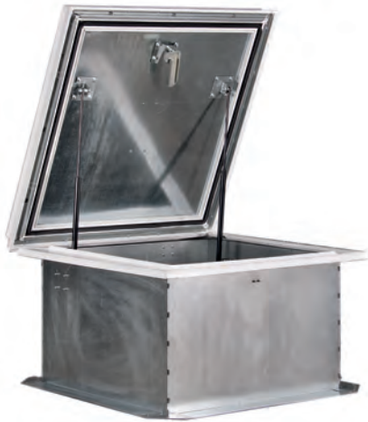
Люк КЛАПАР®-ВК с непрозрачной крышкой