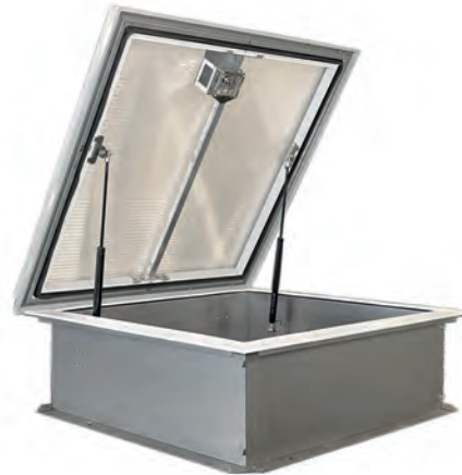
Люк КЛАПАР®-ВК со светопрозрачной крышкой

Люки КЛАПАР®-ВК предназначены для выхода на кровлю с целью ее ремонта и проведения других эксплуатационных работ, а также естественного освещения помещений при изготовлении крышки люка из светопрозрачного материала.