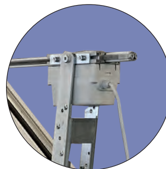
Реечный электропривод серии DXD фирмы D+H

Электроприводы фирмы D+H имеют разную длину рейки, что позволяет изготавливать одностворчатые дымовые люки КЛАПАР® и открывающиеся для естественной вентиляции зенитные фонари КЛАПАР®-ФВ с разными углами открывания крышки.